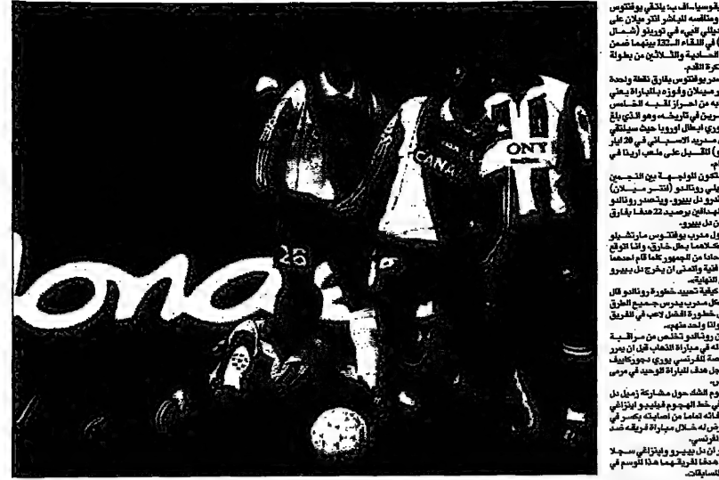
لقطة من إحدى مباريات يوفنتوس مع ميلان

في مباريات الأندية الأوروبية، يفتتح موسم البطولة المحلية الأوروبية ببطولة يوفنتوس وانتر ميلان التي يلتقيان للمرة الـ 132. وتعد هذه المباراة من أكثر المباريات التي تجذب انتباه الجماهير في الدوري الإيطالي. وتعد هذه المباراة من أكثر المباريات التي تجذب انتباه الجماهير في الدوري الإيطالي.